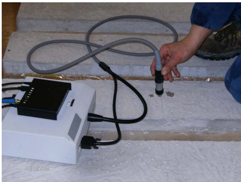
Fig. 5 - Rilevamento delle microfessure con l'ausilio di una sonda collegata a un microscopio ottico.

Le lastre confezionate con i due calcestruzzi (Control e Admix) e trattati o meno con il rivestimento impermeabile in superficie sono state conservate in laboratorio con una umidità variabile tra il 70 e l' 80 %. Per rendere più realistiche le condizioni ambientali ogni lastra è stata esposta a un ventilatore per favorire la rimozione dell'umidità dalla superficie del calcestruzzo. A tempi variabili tra 1 e 240 ore le lastre sono state monitorate con una sonda elettronica capace di evidenziare l'apparizione delle fessure (Fig. 5)