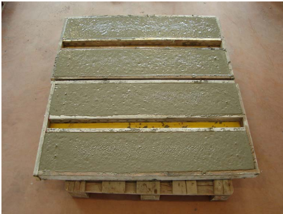
Fig. 2 - Vista d'insieme di alcune lastre vincolate dopo il getto del calcestruzzo