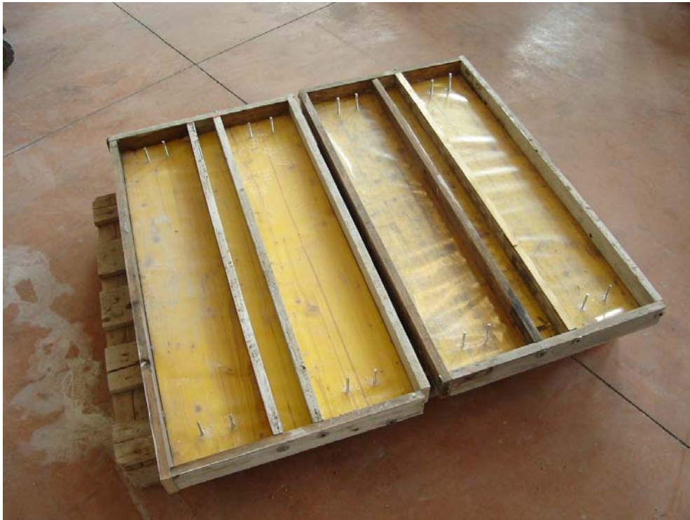
Fig. 1 - Casseri con fissaggi metallici alle estremità per la produzione di lastre vincolate

UNI 6555. Le lastre sono state sformate a 1 giorno oppure a 7 giorni; esse sono state quindi bloccate alle due estremità con fissaggi meccanici (Fig. 1 e 2) ed infine sono state esposte all'aria ventilata di laboratorio per simulare condizioni ambientali esterne e favorire la fessurazione a seguito del ritiro vincolato.