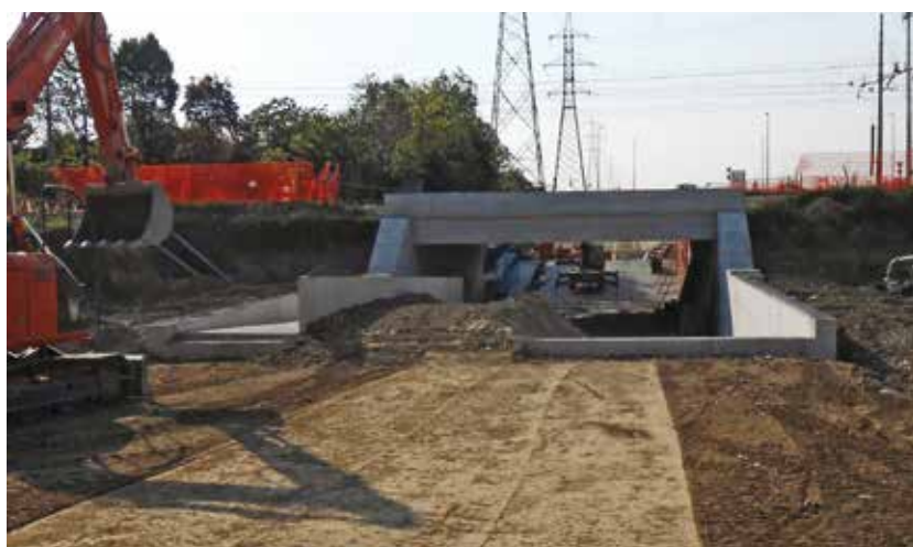
4. Il sottopasso RFI a San Zeno Naviglio (BS)

Contestualmente, essendo opere che perlopiù interessano il tessuto urbano, risulta molto importante che le tempistiche di