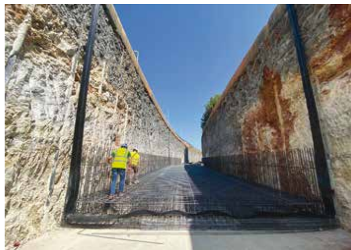
6. La linea ferrotramviaria interrata di Andria