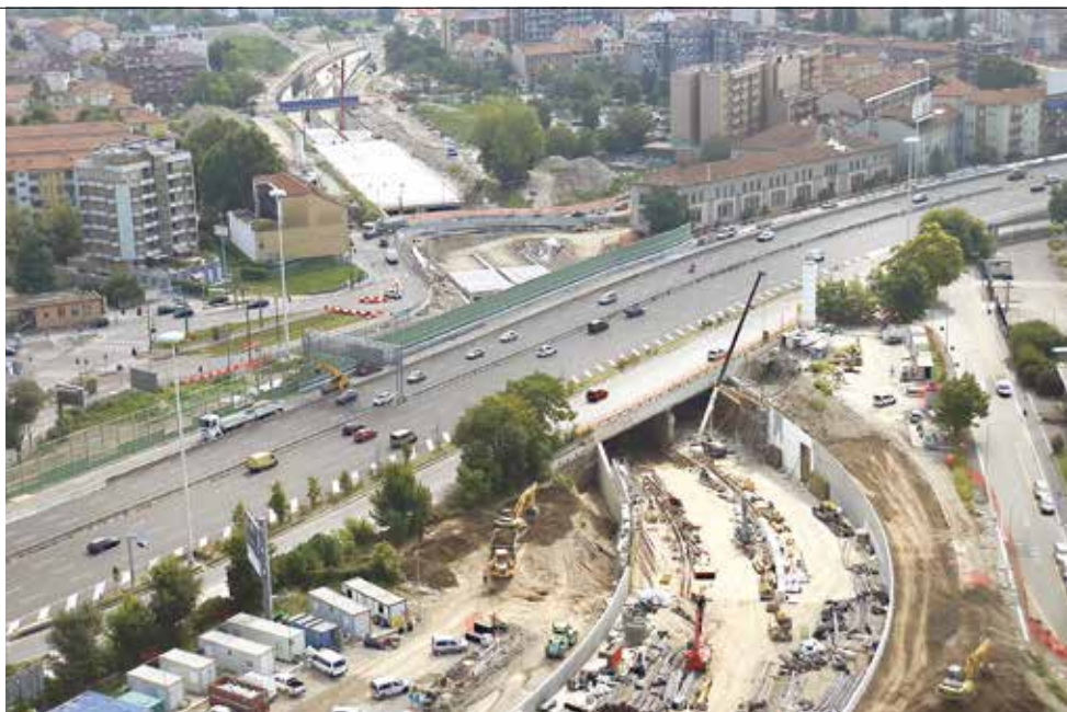
5. Il tunnel Zara presso il Lotto 1A EXPO (MI)

Tale intervento, eseguito dall'Impresa CMB - Cooperativa Muratori e Braccianti di Carpi, è la risposta all'improrogabile necessità della città di superare la sua dimensione di città "divisa" in due con un territorio altamente urbanizzato; una città che convive da sempre con una densa maglia urbana spaccata dalla presenza fisica della linea ferroviaria con tutti i disagi che da essa ne scaturiscono.