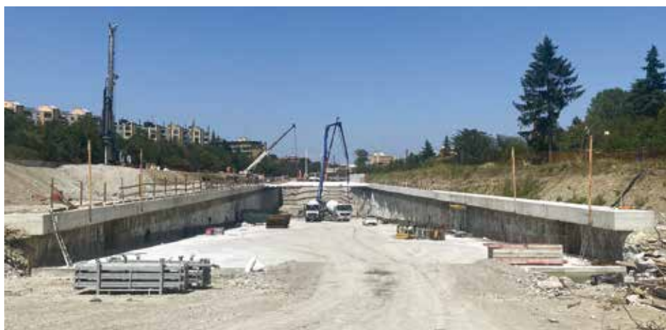
2. Tunnel artificiale di tangenziale

permeabilizzazione esterni in adesione o confinamento (le vasche nere, metodo tradizionale in guaina bituminosa, PVC, teli bentonitici, ecc.).