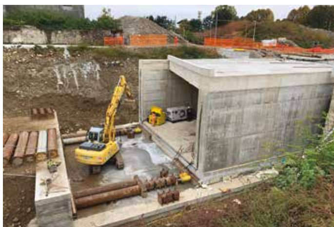
3. Il monolite a spinta nel sottopasso RFI a Borgomanero (NO)

permeabilizzazione esterni in adesione o confinamento (le vasche nere, metodo tradizionale in guaina bituminosa, PVC, teli bentonitici, ecc.).